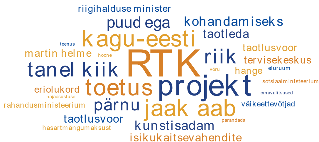
Joonis 1. Sõnapilv 2020.a RTKst meedias ilmunud artiklites enim esinenud sõnadest